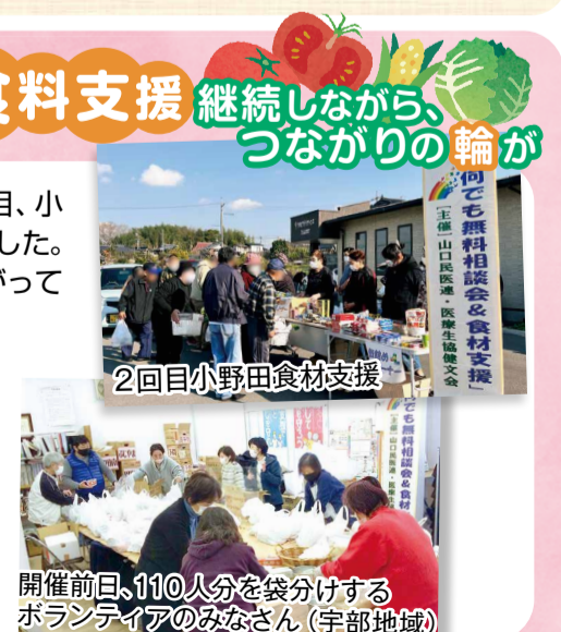
開催前日、110人分を袋分けするボランティアのみなさん(宇部地域)