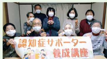
「認知症サポーター養成講座」を受けた恩田中央支部のみなさん